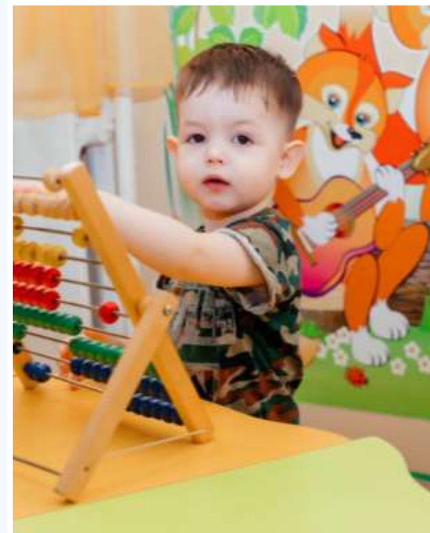
Занятия по математике