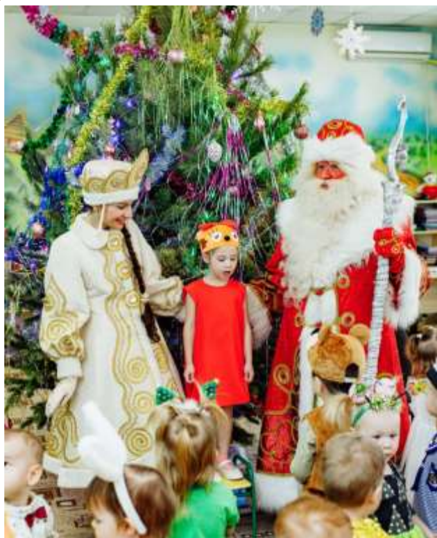
Новый год в ЧУ ДОО Алёнка