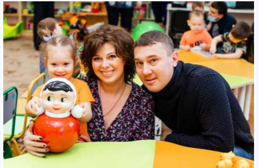
Встречи с родителями стали традицией ЧУ ДОО Алёнка